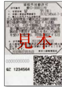
シールタイプ (パスポートに貼付されます)